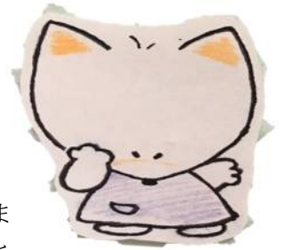
illustration by yanagida

涼しい日がやって来たかと思えば台風の来襲など、なかなか落ち着いた気候ではありませんが、体調に留意して元気に毎日を過ごしたいですね！